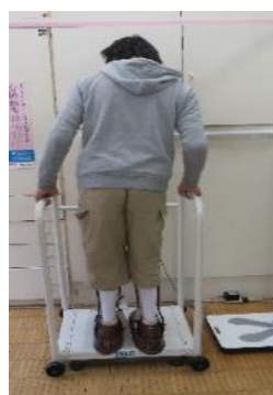
手すり付き体重計